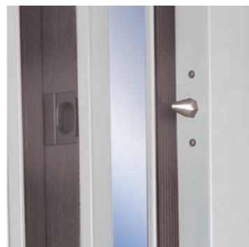
rostri di chiusura