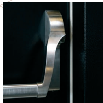
dettaglio maniglione antipanico