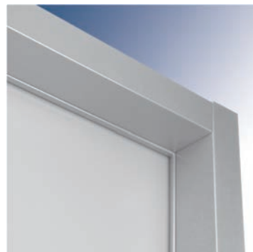
telaio ad imbotta