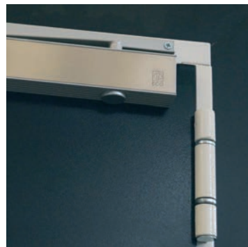
chiudiporta e traversa superiore