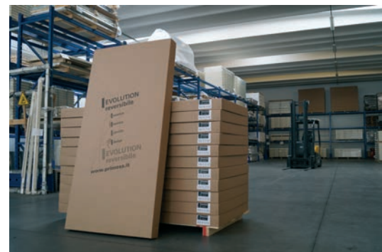
imballo in cartone